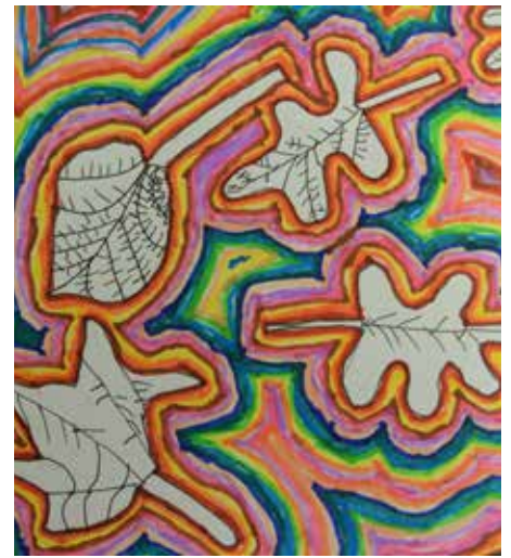
Kökényesi Abigél 2.z alkotása