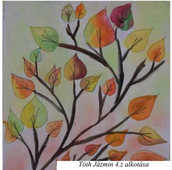
Tóth Jázmin 4.z alkotása

Szencen született, apja pedig molnár volt, innen a neve. Kisdiákként először Göncön tanult, csodálva és segítve az istenes vénember, Károlyi Gáspár tudós bibliafordító lelkipásztor munkáját azzal, hogy naponta gyalog vitte át a vizsolyi nyomdába a kinyomtatásra szánt lapokat. Így ír erről: "Az Bibliát kibocsáták Visolban az nagyságos Rákóczi Zsigmondnak és több tekintetes uraknak kegyes segedelmekkel, mely első kibocsátásnak szolgálatjában akkori gyermekségemben is részessé tölt engemet az Istennek gondviselése. Holott az időben lábánál forganék az böcsületes embernek, Károlyi Gáspárnak, az gönci prédikátornak, az ki fő igazgatója volt az kinyomtatásnak, és engem gyakorta a Visoli nyomtató helyben kiküldött az ő tőle írott levelecskével". Ekkor született meg benne a vágy, hogy valami hasonlóan értékes dologgal ajándékozza meg magyar református népét. Debrecenbe ment, ahonnan külföldre indult, majd bejárta Európa számos híres egyetemét és városát, s megtanulta a nyomdász mesterséget is. A gyülekezet csodálatos zsoltáréneklése Genfben ragadta meg. Milyen nagyszerű lenne, ha így tudnánk énekelni! A vágyat tett követte, s "Mínd a százötven zsoltár szövegét magyar nyelvre fordította Marot Kelemen és Béza Tódor francia verseiből 1606. március 9. és május 24., valamint szeptember 1-23. napjai közötti időben, tehát nem egészen száz nap alatt Szenci Molnár Albert (1574-1634). Munkájának végeztével ezt írta naplójába: " Laus viventi Deo" (Dicsőség az élő Isten-