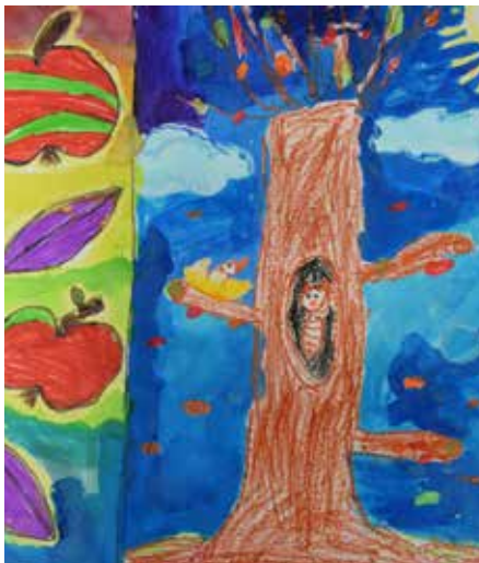
Galloff Léna 2.b alkotása