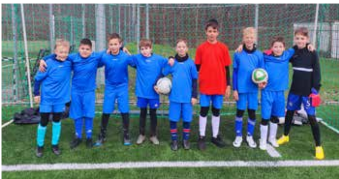
Iskolánk Bozsik torna győztes csapata