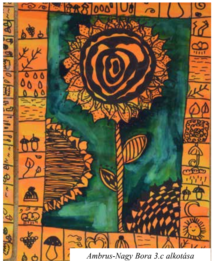
Ambrus-Nagy Bora 3.c alkotása