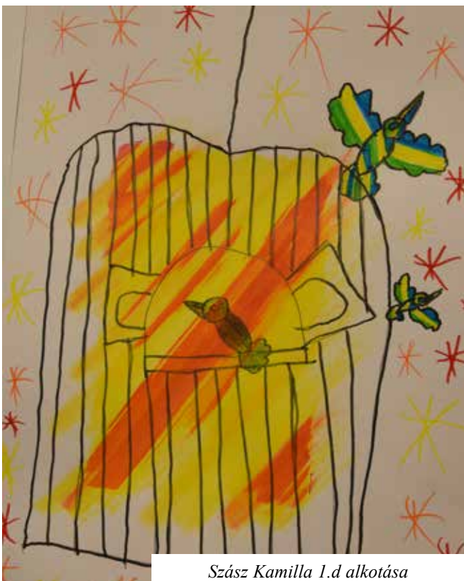
Szász Kamilla 1.d alkotása