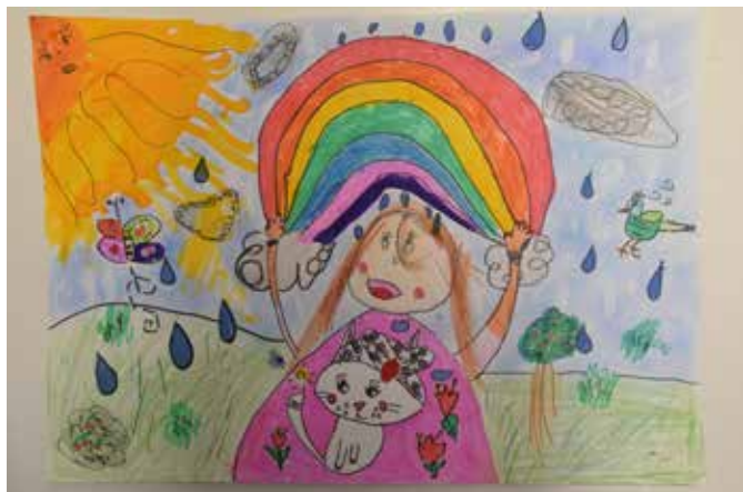
Nagy-Makai Flóra 2.z alkotása