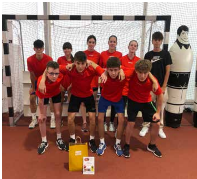
Az ügyességi versenyen szereplő csapatunk